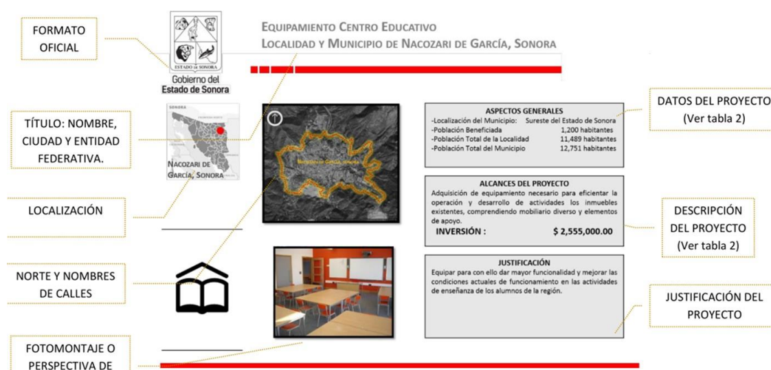
Imagen 2. Ejemplo de Ficha Técnica Gráfica de Edificación