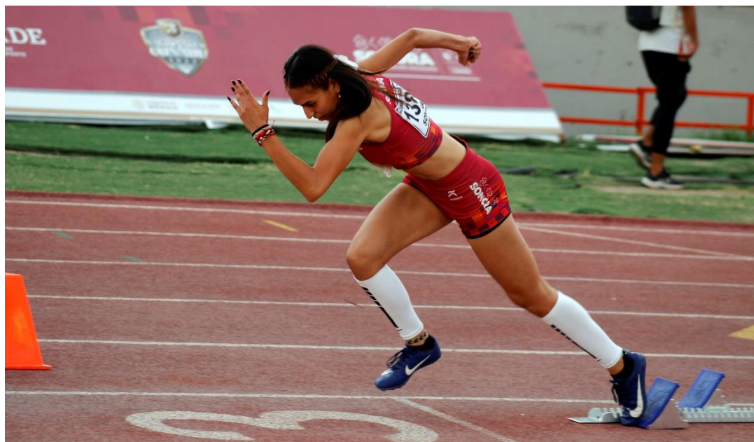
Nacionales CONADE 2022.