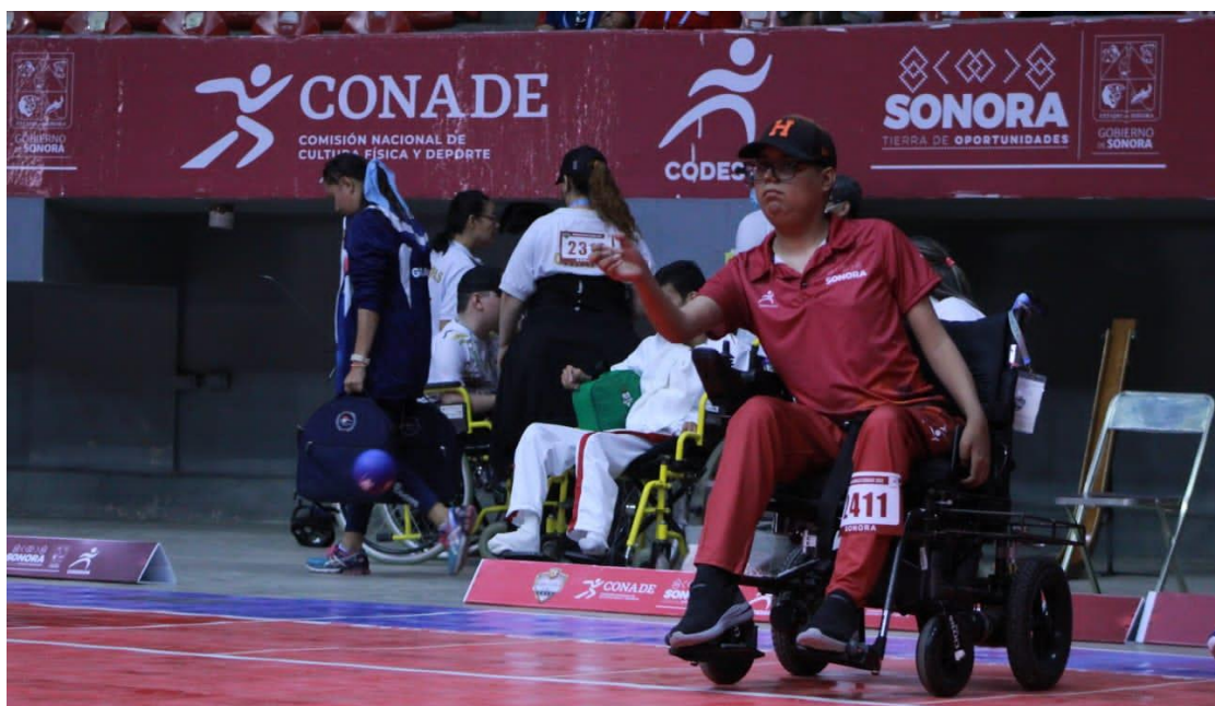
Paranacionales CONADE 2022.