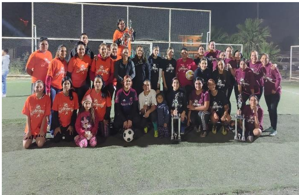
Torneo Navideño softbol en la categoría femenil.