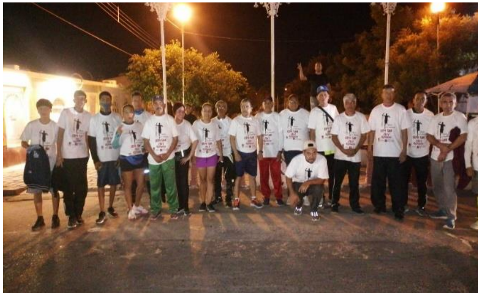
Carrera Pedestre 24 hrs. Empalme.