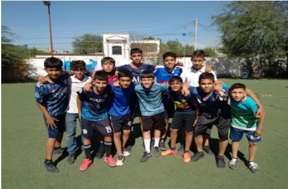
Torneo de Fútbol Soccer Secundaria Técnica No. 57