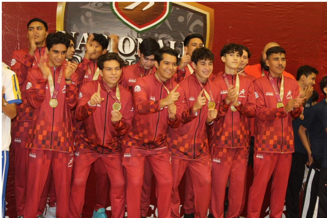
Nacionales CONADE 2022.

Además, desde hace ocho años, el equipo sonorense no llegaba o pasaba de las 60 preseas del máximo color, cuando ganó 64 en 2014. Por lo tanto, la otra actuación más cercana a esa cifra, en las últimas nueve ediciones que comprende el periodo entre el 2014 y 2021 (el 2020 se canceló por la pandemia), fueron las 58 obtenidas en 2019.