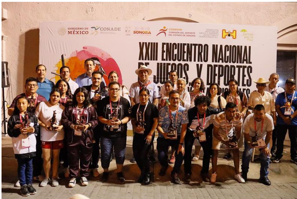
XXIII Encuentro Nacional de Juegos y Deportes Autóctonos y Tradicionales.

Dentro de los servicios que la entidad ofreció a los participantes fue el hospedaje, asistencia médica, alimentación y transporte local para traslados al área de competencia, comedor y hoteles. Este evento se realizó en coordinación con la Comisión Nacional de Cultura Física y Deporte CONADE, con una inversión federal de $4,000,000 pesos. Los espacios que se utilizaron fueron la explanada del Palacio de Gobierno del Estado y del Ayuntamiento de Hermosillo, Pabellón de Pelota de la Unidad Deportiva del Noroeste, la Plaza Alonso Vidal, Plaza Bicentenario y el Auditorio de la Casa de la Cultura.