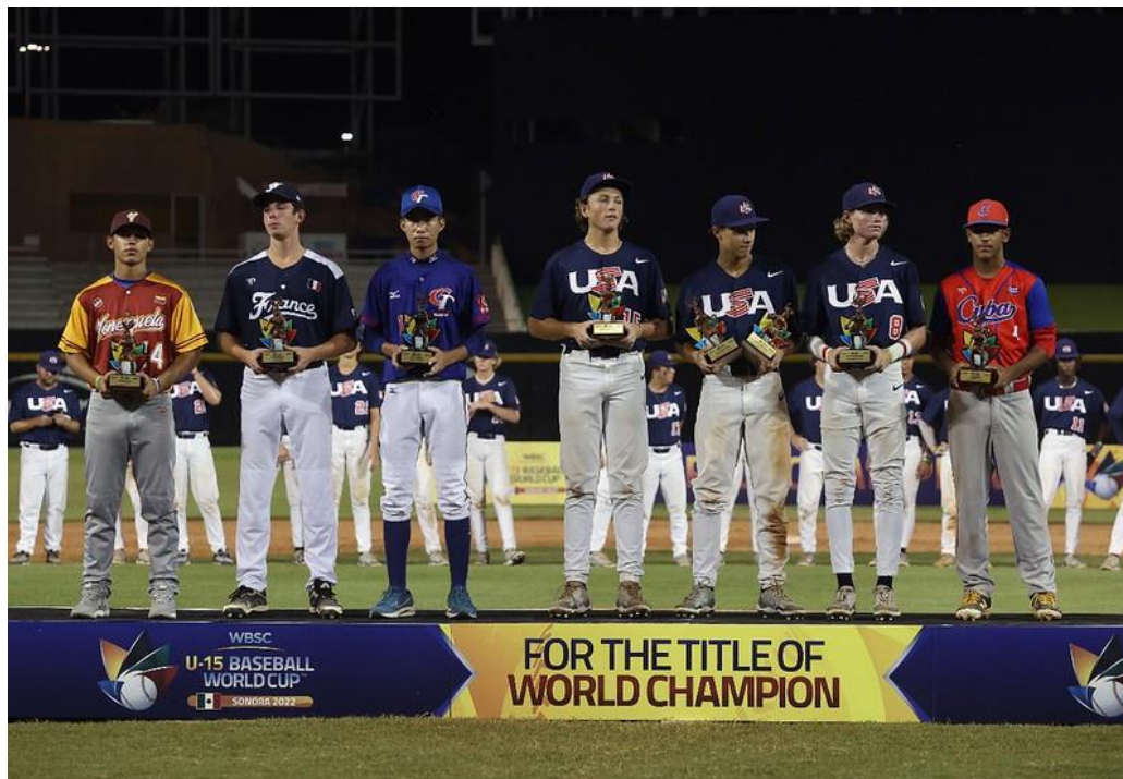
Campeonato Mundial de Béisbol, categoría U-15.