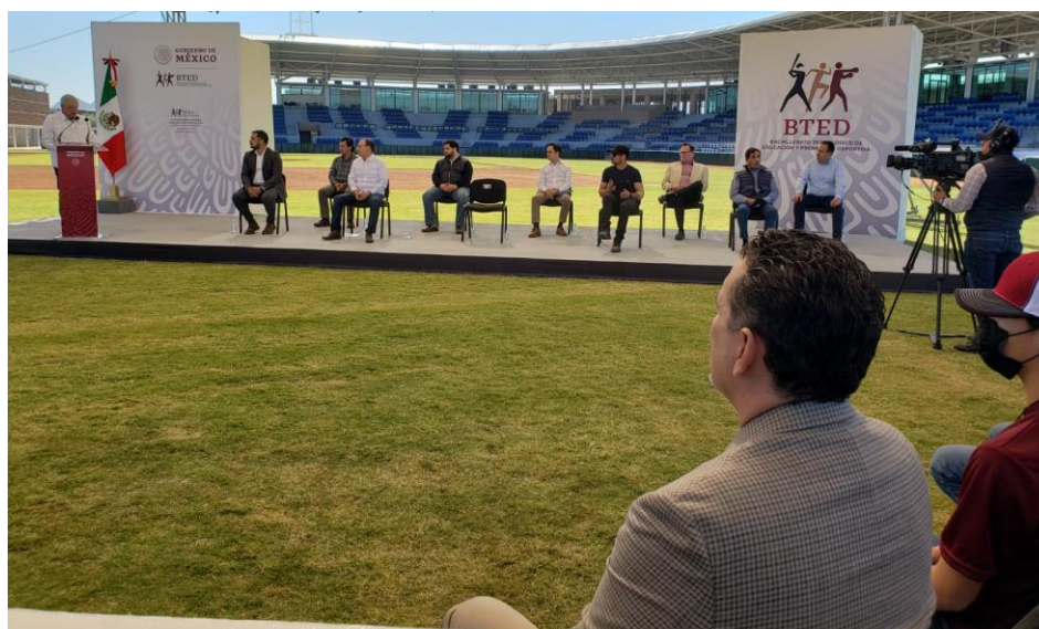
Bachillerato Tecnológico de Educación y Promoción Deportiva, BTED.

A inicio del 2022 se inauguraron las instalaciones del (BTED) en Hermosillo y Cd. Obregón, espacio que ofrece carreras técnicas para cursar la educación media superior con un enfoque deportivo combinando la formación educativa y deportiva de los jóvenes mexicanos, junto con el proyecto de rescate y remodelación del estadio “Héctor Espino”, antigua casa de los Naranjeros, la educación y el deporte se combinan. Al cierre del ejercicio